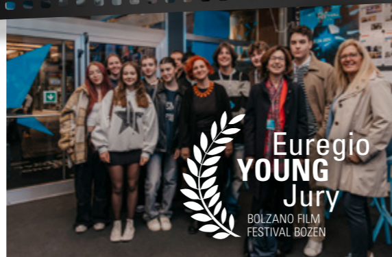
Euregio YOUNG Jury 2024.

Il progetto è a cura del GECT - Gruppo europeo di cooperazione territoriale - Euroregione Tirolo - Alto Adige - Trentino e verrà organizzato dal Bolzano Film Festival in collaborazione con lo Jugenddienst Bozen.